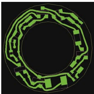
Рис. 2. Топология однослойной печатной платы

Довольно часто схема, уже запущенная в производство, подвергается незначительной доработке, например добавляется одна или несколько связей. Но на плате для этих связей места не оказывается. Вот если бы чуть-чуть раздвинуть несколько элементов... Но изменение расположения элементов на плотно оттрассированной плате при помощи редакторов, включаемых в современные САПР, — тяжелый ручной труд, сравнимый с полной ручной трассировкой платы и чреватый теми же ошибками.